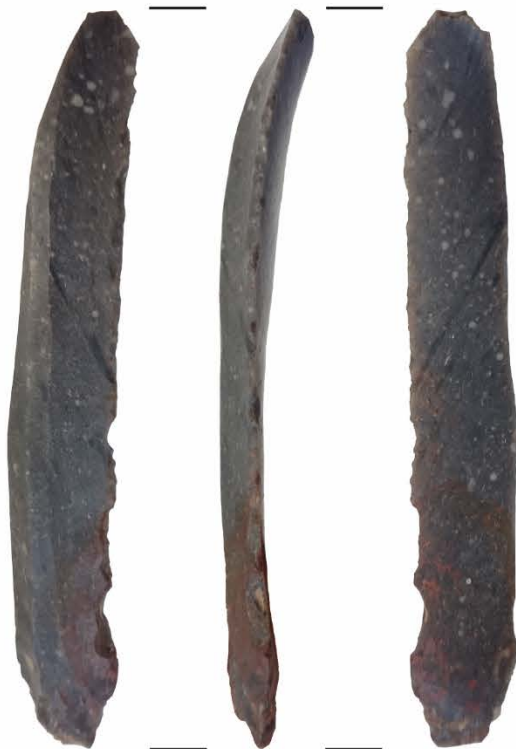
Klinge aus Feuerstein mit Hämatitfärbung (rote Bereiche)