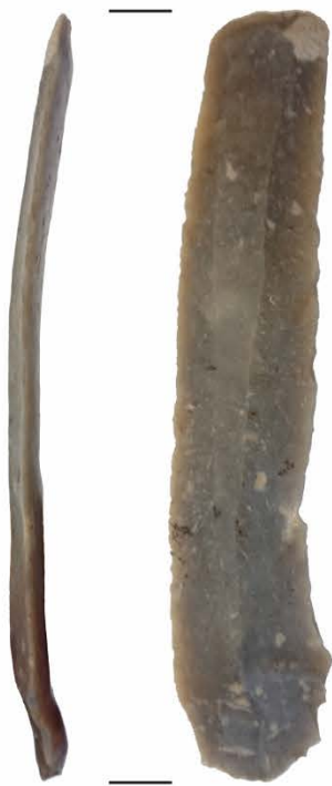
Klinge aus Feuerstein