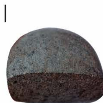
Beilklinge aus Amphibolit (nicht maßstabsgetreu)