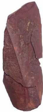
Artefakt aus Hämatit