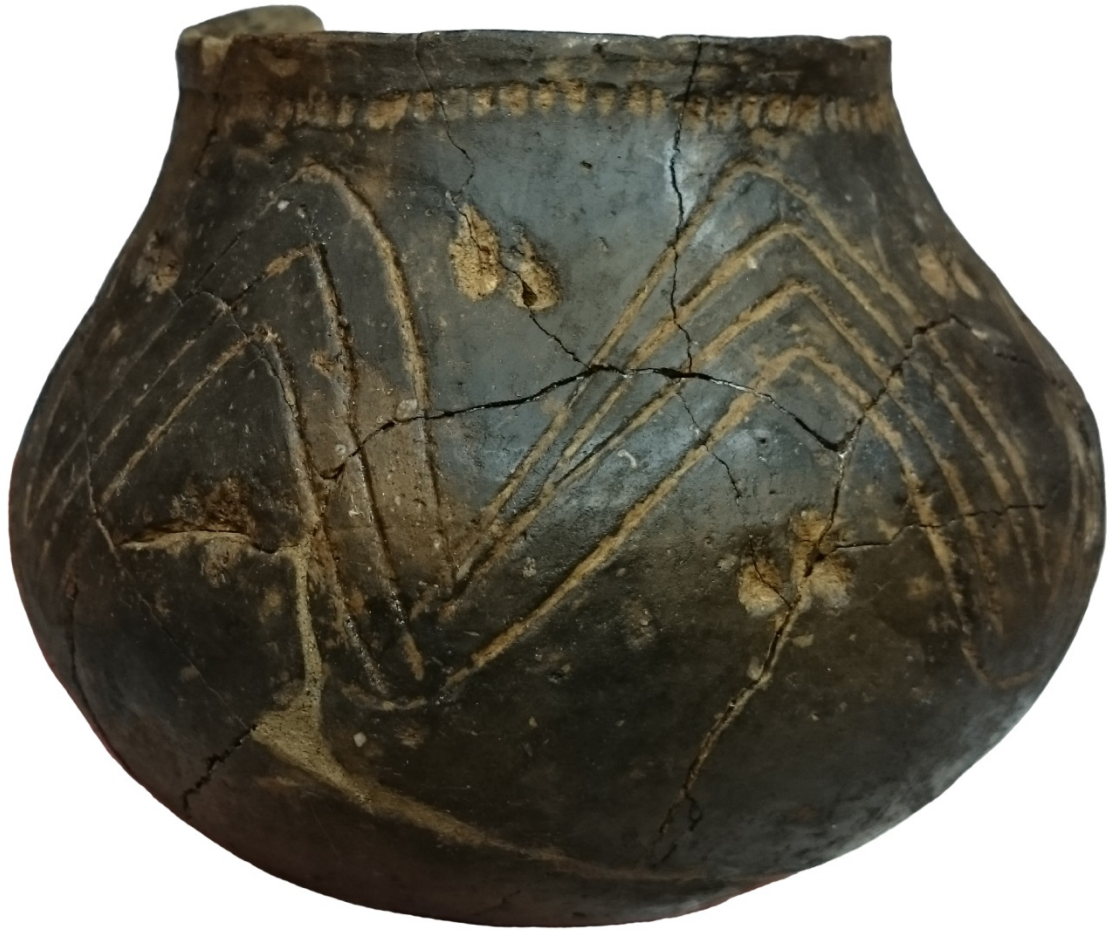
Abbildung 3. Keramikgefäß der jüngeren bis jüngsten Linearbandkeramik aus einer Grabgrube des Gräberfeldes.