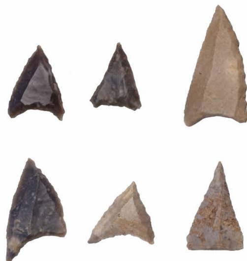
Pfeilspitzen aus Feuerstein