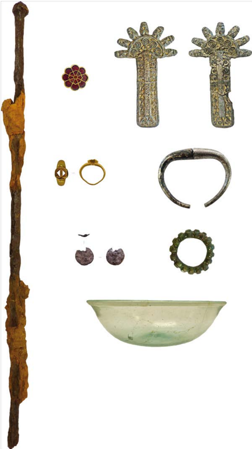
Abbildung 2: Auswahl an Beigaben aus Grab 589: 1 Faltstuhlachse, 2 Granatscheibenfibel, 3 Bügelfibeln, 4 Fingerring, 5 Kolbenarmreif, 6 Münzanhänger, 7 Noppenring, 8 Glasschälchen