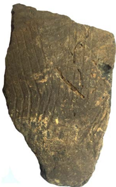
Abbildung 2: Fragment eines mit „Kammstrich“ verzierten Keramikgefäßes. (Urheber: Jan Linden, Erstellung: Torsten Rüniger)