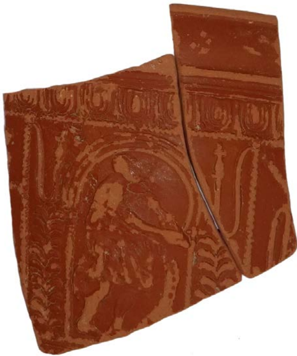
Abbildung 2: Fragment eines reliefverzierten Terra-Sigillata Bechers