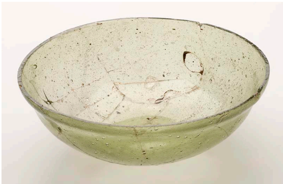
Abbildung 3: Glasschale aus einem spätantiken Grab.