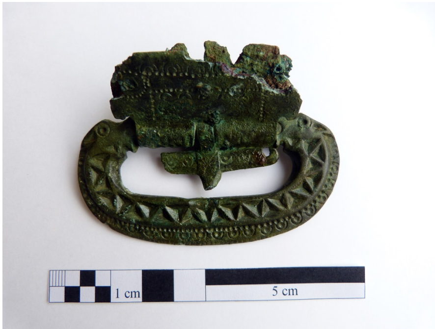
Abbildung 2: Schnalle einer spätantiken Kerbschnittgürtelgarnitur.