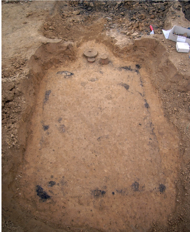
Abbildung 4: Mittelkaiserzeitliches Brandgrubengrab mit Beigabennische im Westen.