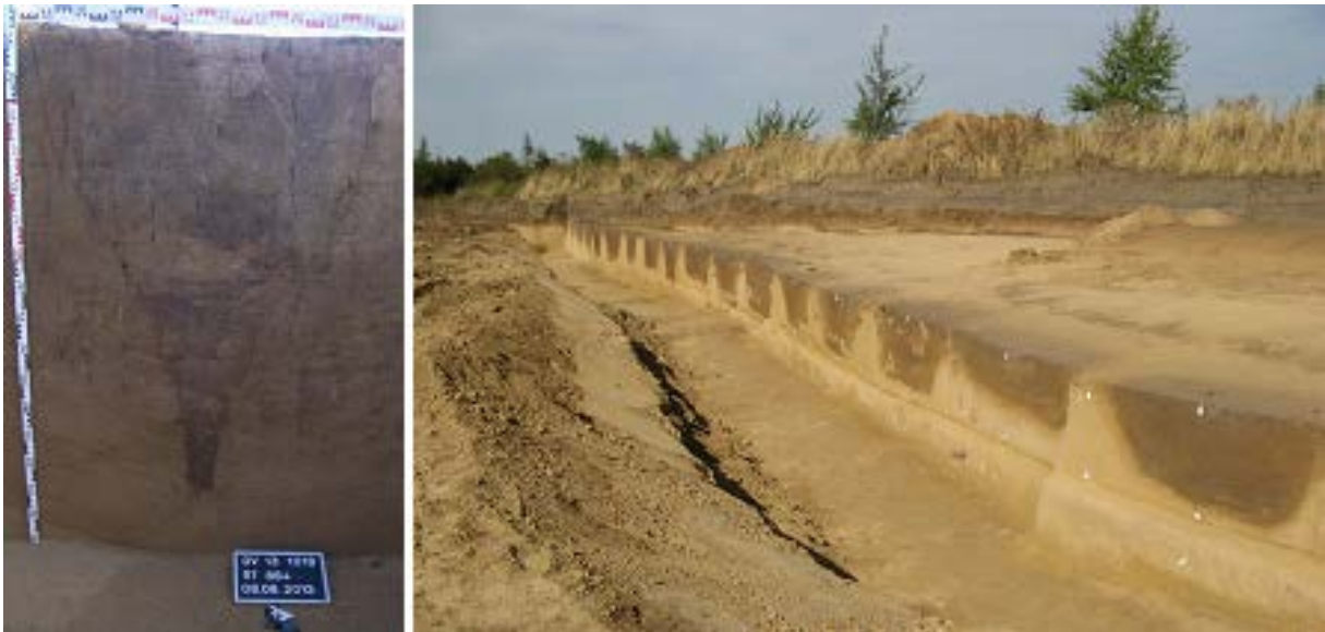
Abbildung 2: archäologische „Rätselbefunde“, links: eine Schlitzgrube aus dem Rheinland, rechts: eine Grubenreihe aus dem Mitteldeutschen Trockengebiet