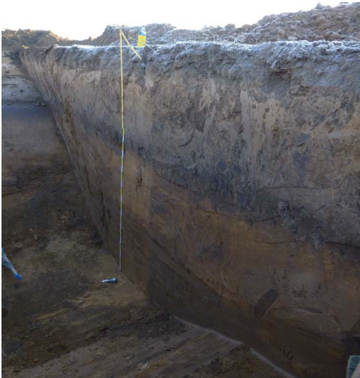
Abbildung 1: kolluviale Ablagerungen in einer Senke auf einer landwirtschaftlich genutzten Fläche