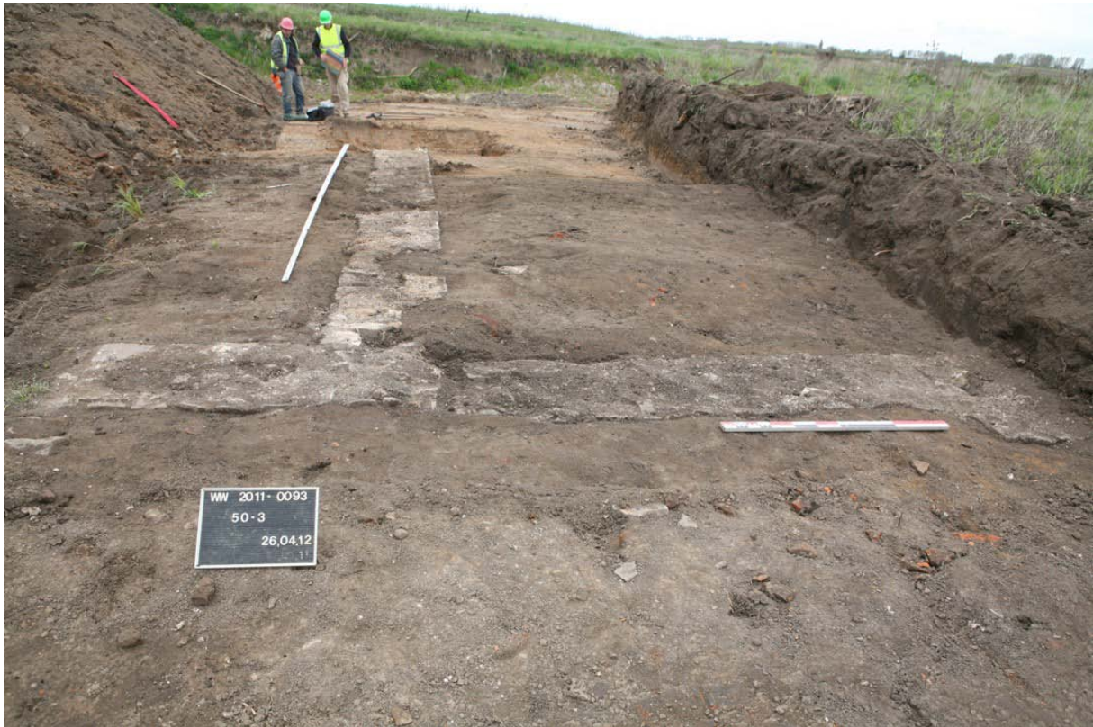
Abbildung 3. Römische Fundamente kurz nach der Freilegung durch RWE-Mitarbeiter; zwischen den Fundamenten liegen frühmittelalterliche Kulturschichten.