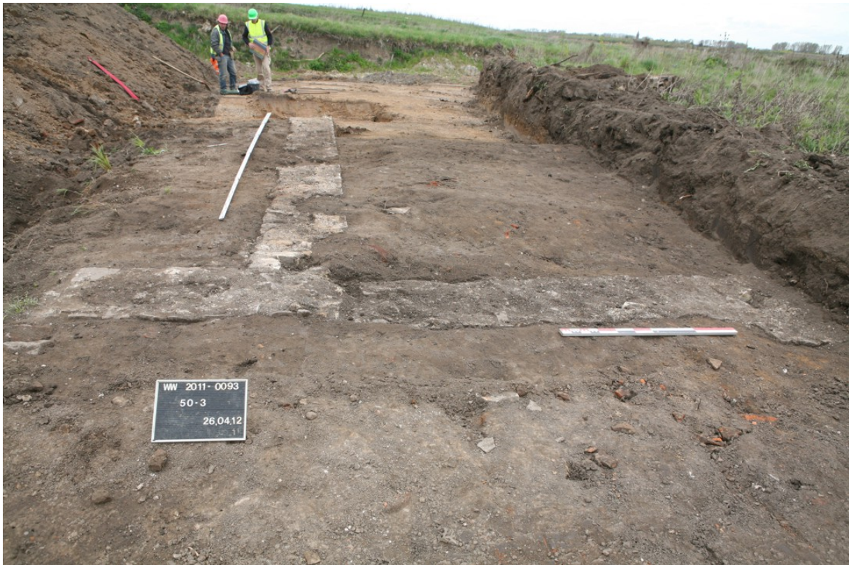
Abbildung 3. Römische Fundamente kurz nach der Freilegung durch RWE-Mitarbeiter; zwischen den Fundamenten liegen frühmittelalterliche Kulturschichten.