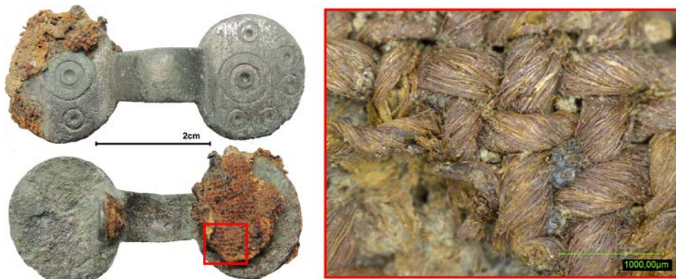
Abbildung 2: Vorder- und Rückseite einer Bügelfibel mit textilen Anhaftungen nach der konservatorischen Bearbeitung. Mikroskopische Aufnahme des Gewebes