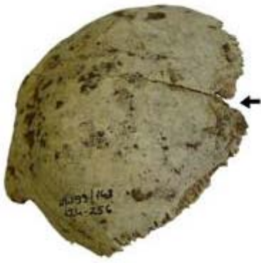
Menschliches Schädelfragment, mit Schlagspuren (siehe Pfeil)