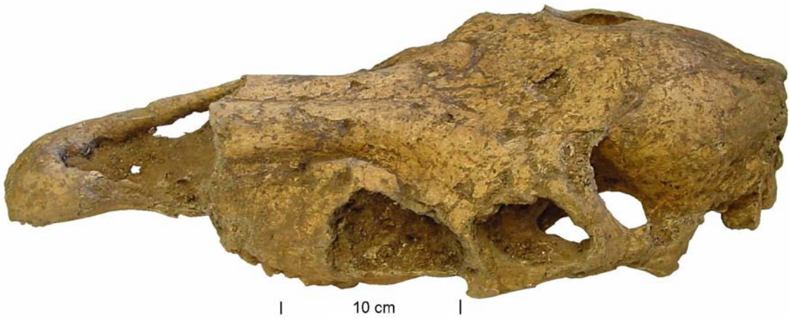
Schädel vom Pferd