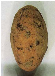
Tonschleuderkugel (aus: PÄFFGEN / WENDT 2000, 62, Abbildung 47.)