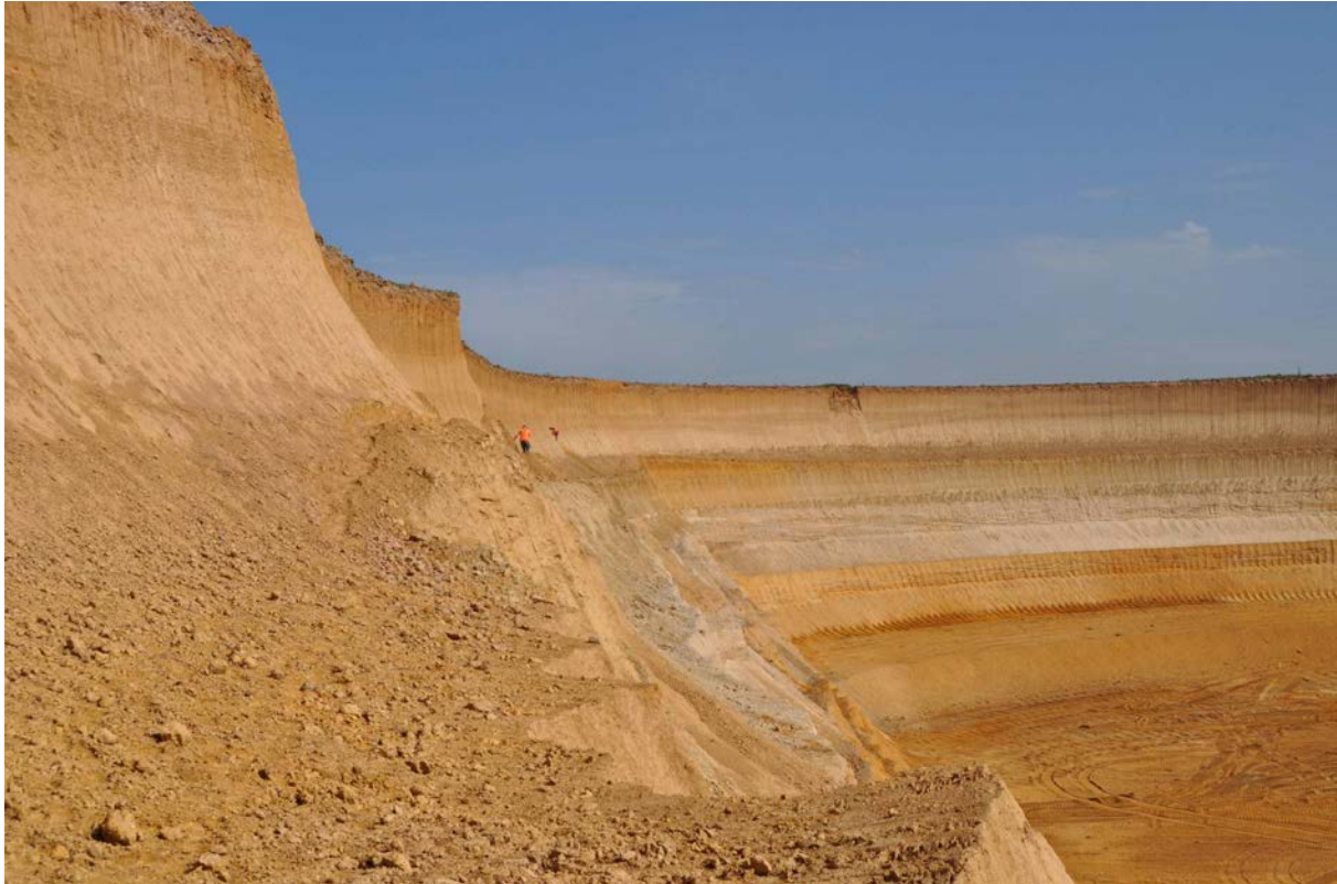
Abbildung 1. Tagebau Garzweiler. Die Abbaukante nördlich der Ortschaft Borschemich (LANU-Projekt)