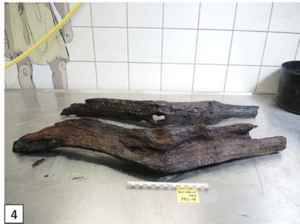
Abbildung 1–4: (1) Vorsichtiges Entfernen der Verpackung (Nguyen Thi Nu Hoa); (2) und (3) Einlieferungszustand vor der Reinigung; (4) Einlieferungszustand nach der Reinigung (Abbildung 2-4: S. Oppl).