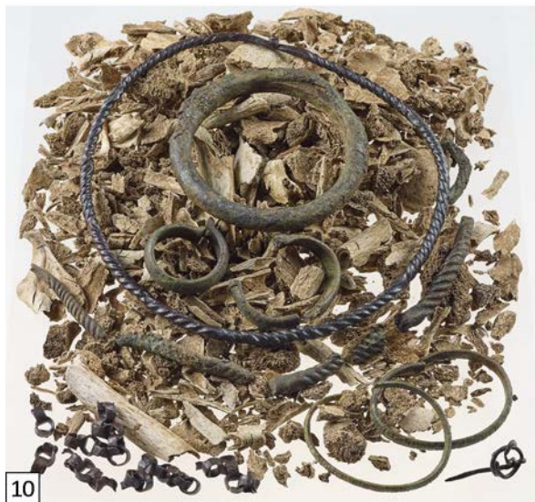
Abbildung 8–10: (8) Übersichtsfoto von Planum 2 während der Bearbeitung; (9) Planum 2 mit Kennzeichnung, um eine spätere Rekonstruktion der Fundlage zu erleichtern; (10) Fundpräsentation in der Ausstellung „Archäologie im Rheinland 2016“.

Stelle 210 ist ein reich bestücktes Urnengrab mit kurzer Nadel und Gliederkette, sowie einem tordierten Halsreifen aus Eisen, einem ebenfalls tordierten Halsreif aus einer Kupferlegierung (Bronze), einem Oberarmring mit Tonkern, zwei Schläfenringen und 9 Armreifen mit Strichverzierungen (Abbildung 8-10), alle ebenfalls aus einer Buntmetalllegierung.