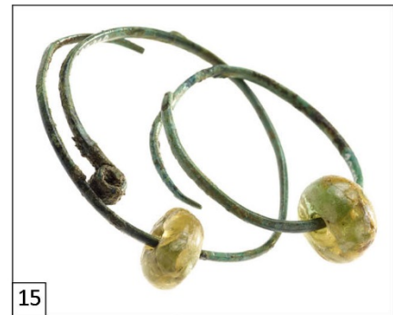
Abbildung 11–15: (11) Einlieferungszustand des Blocks; (12) Fundpräsentation in der Ausstellung; (13) Wendelhalsring aus Mayen, 600–500 vor Christus; (14) Armringe aus Hunolstein 450–250 vor Christus (15) Ohrringe aus Heimbach-Weis, 600–475 vor Christus.

Weitere Urnen aus den Befunden dieser Aktivität enthalten Metallbeigaben in Form von unter anderem Gewandnadeln aus Eisen, einem hohl gearbeiteten Bronzehalsreif mit eingravierter Linienverzierung oder einem flachen, aus Bronzeblech gebogenen Armreif mit Ritzverzierung.