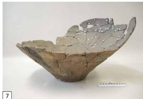
Abbildung 5-7: (5) Einlieferungszustand der Scherben von Stelle HA 2011/0001 Stelle 70; (6) rekonstruiertes Gefäß (Stelle 70); (7) rekonstruiertes Gefäß (Stelle 211) (Abbildung 5-7: S. Oppl).