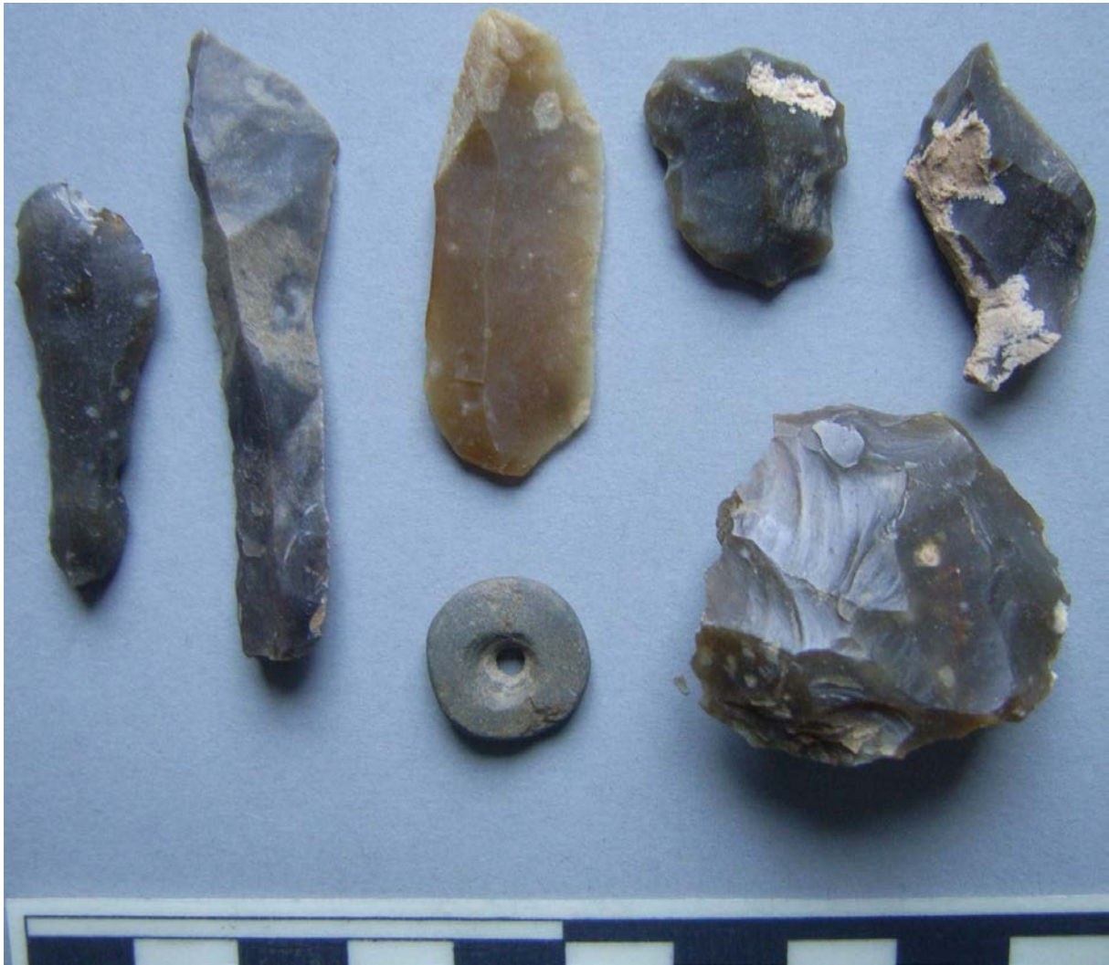
Abbildung 3: Artefakte der Aktivität WW 2013/74. 1 Stielspitze, 2 u. 5 Mögl. Stielspitzenvorarbeiten, 3 Klinge, 4 Kratzer, 6 Rondell 7 Linsenförmiger Kern.