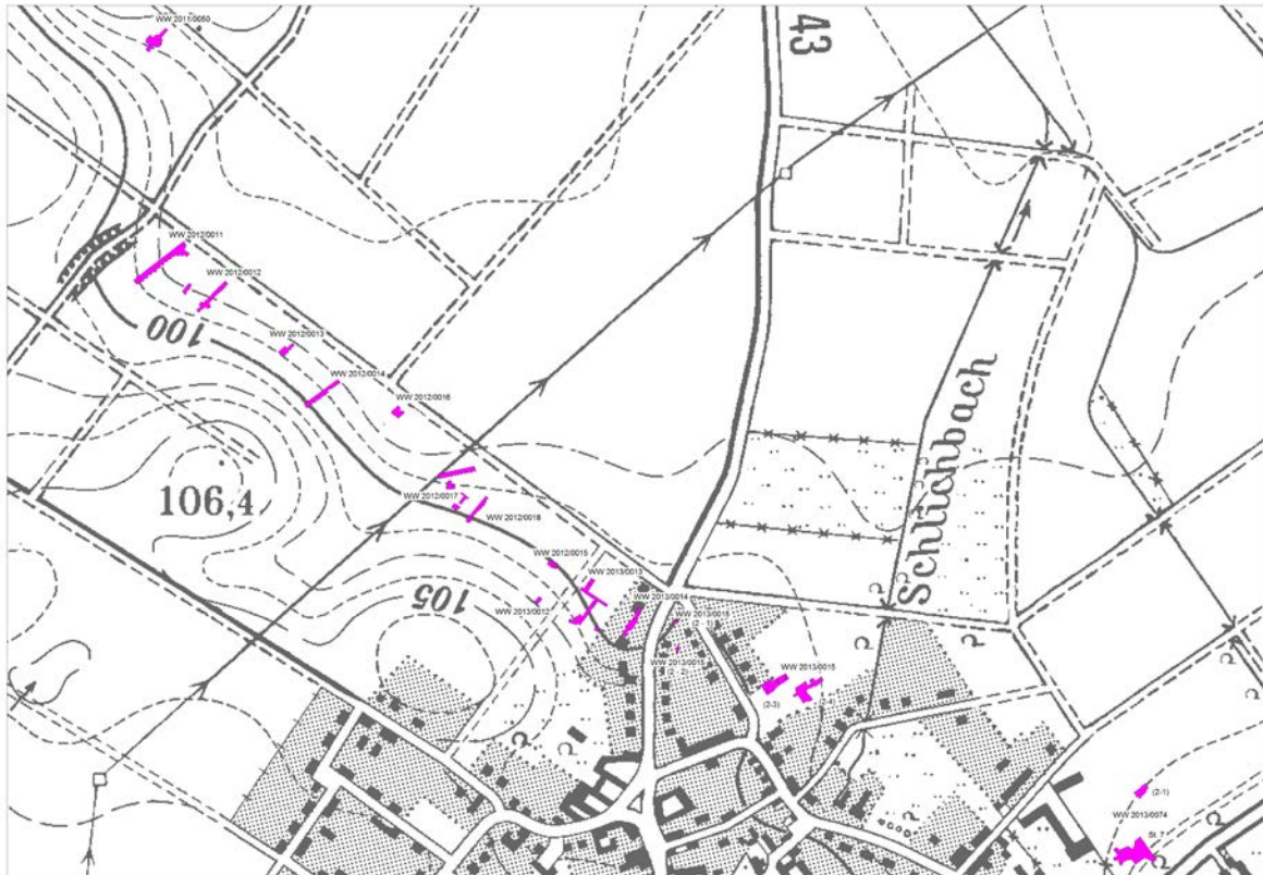
Abbildung 2: Lage der Baggertiefschnitte auf dem südwestlichen Ufer des Rurtals.