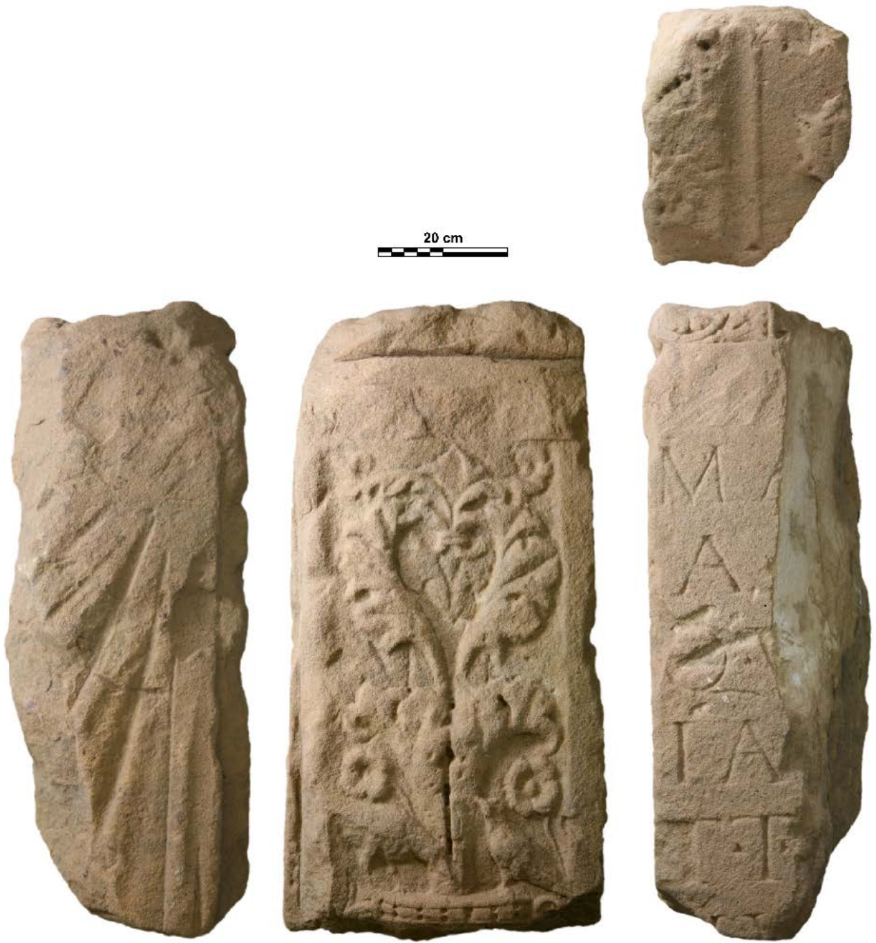
Abbildung 3: Matronenstein, erneut in einer merowingerzeitlichen Grabkammer verbaut.