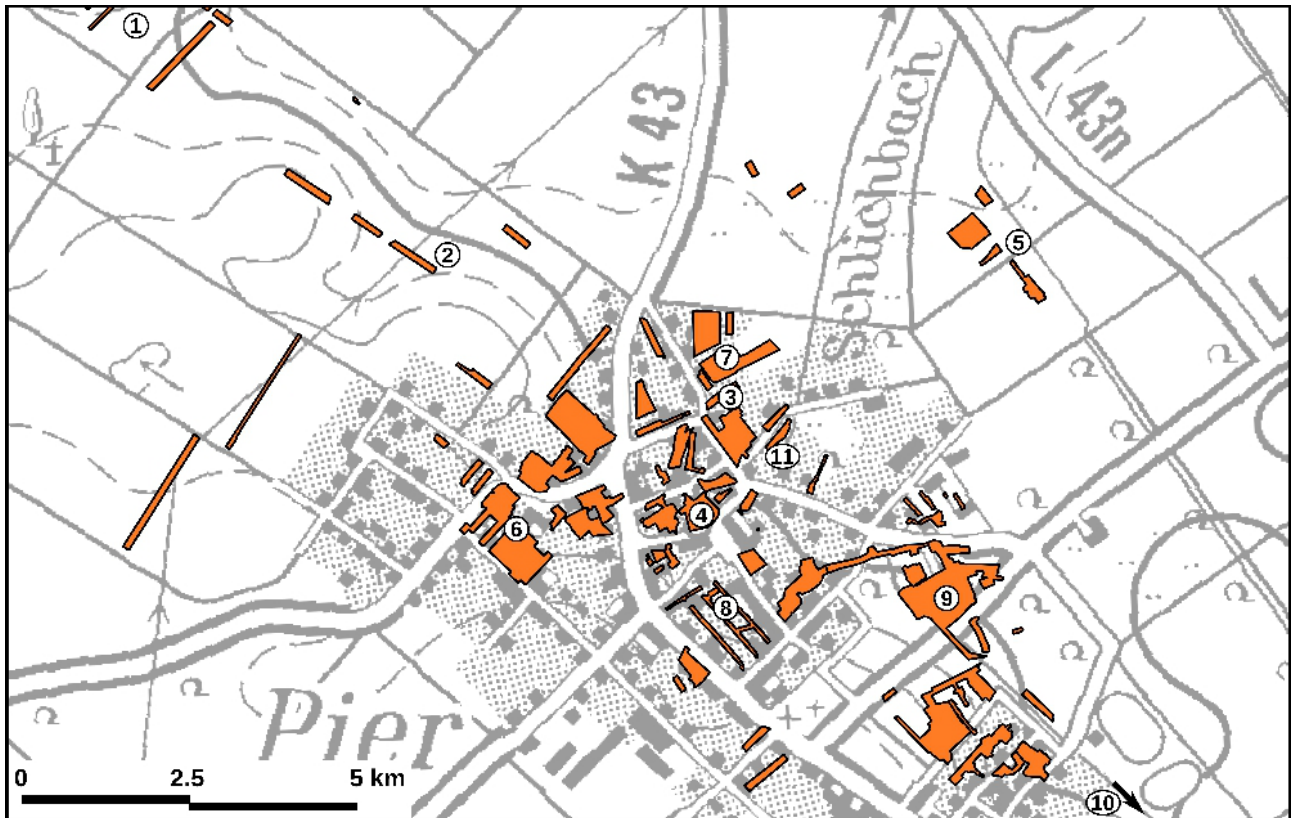
Abbildung 1: Überblick über die Grabungsaktivitäten im „Pier-Projekt“: 1f. villae rusticae; 3 Reste von römischer Siedlung, darüber frühmittelalterliche Lesefunde; 4 merowingerzeitliches Gräberfeld Pier I und Eigenkirche; 5 karolingerzeitlich-hochmittelalterliche Wüstung, wahrscheinlich ein Hof; 6–8 hochmittelalterliche Randbereiche der Siedlung mit kleinräumiger Struktur und zahlreichen Öfen; 9 Haus Pesch; 10 Haus Verken; 11 mögliche Motte.