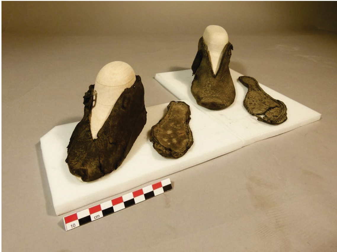
Abbildung 6: Die 2 konservierten und rekonstruierten Schuhe nach der Restaurierung.