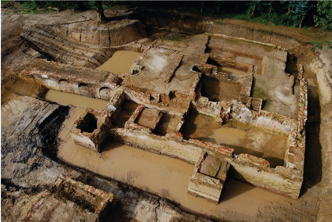
Abbildung 1: Erkelenz-Pesch, Haus Pesch. Grabenseitige Außen- sowie Grundmauern des Herrenhauses nach Freilegung; in der Mitte Keller des zuvor unbekanntes spätmittelalterlichen Wohnturms.