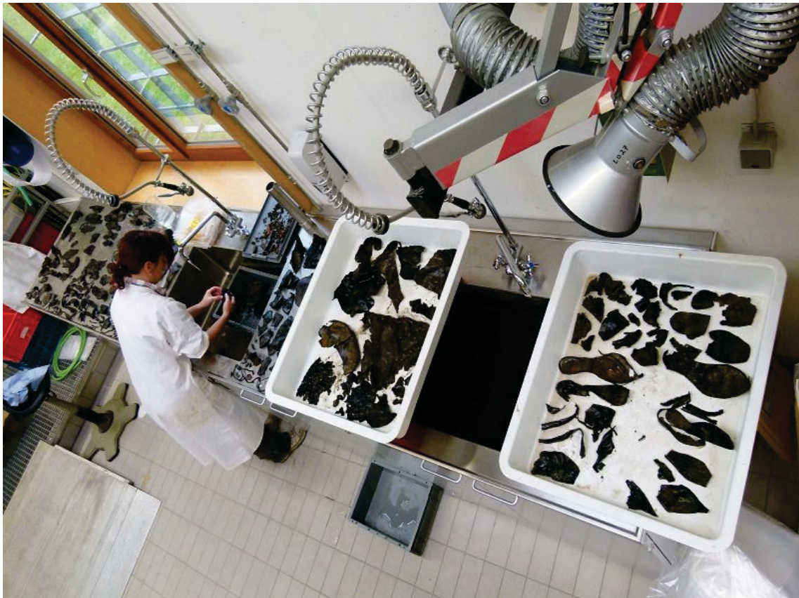
Abbildung 4: Vorreinigung und Sortierung von 32 Tüten mit grabungsfrischen Lederfunden in zahlreichen Fragmenten. Vorbereitung der Fragmente zur Behandlung mit dem Konservierungsmittel.