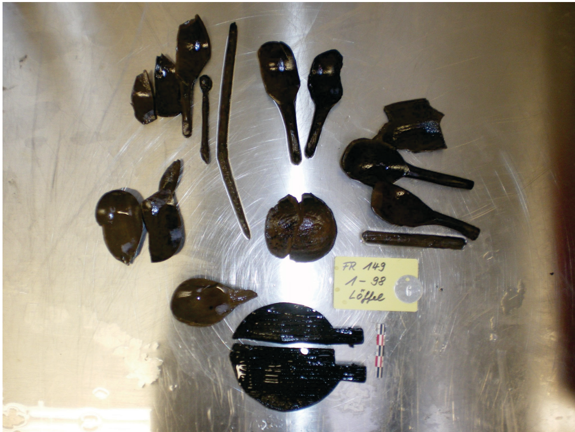
Abbildung 2: Teile von Holzobjekten wie zum Beispiel Löffel, Teile von Tellern und Schalen im gereinigten, fundfrischen Zustand vor Einbringung in die Konservierungslösung.