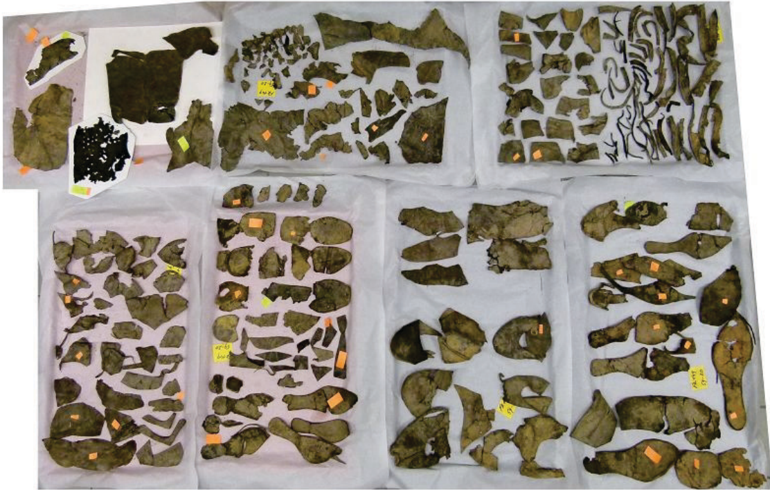
Abbildung 5: Inhalt von 32 Tüten nach Tränkung und Gefriertrocknung im lagerfähigen Zustand.