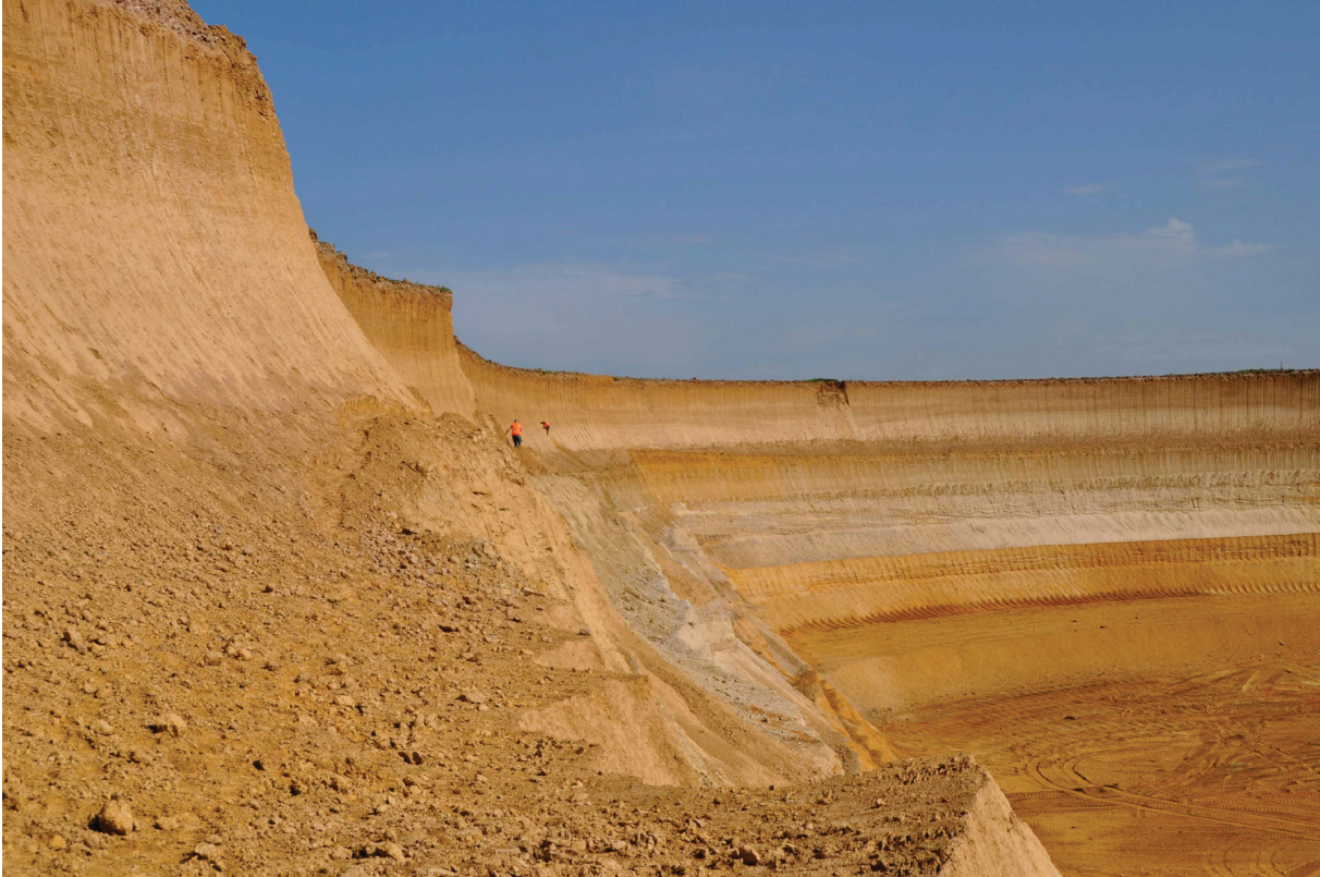
Abbildung 1. Tagebau Garzweiler. Die Abbaukante nördlich der Ortschaft Borschemich (LANU-Projekt)