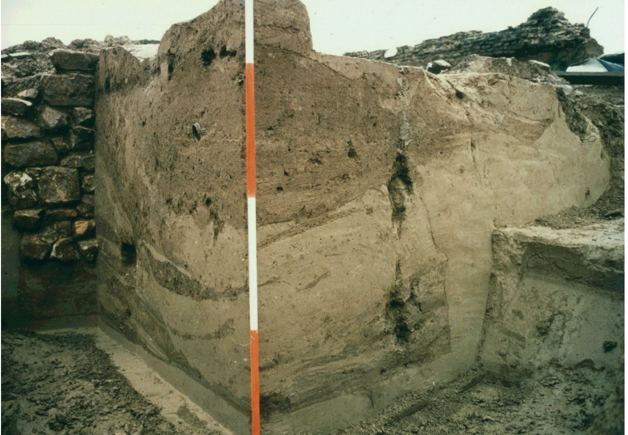
Abbildung 2: Hofanlage Stolzenberg: Erdkeller im Profil