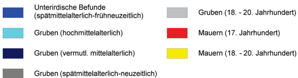
Abbildung 1: Hofanlage Stolzenberg: Gesamtplan der Befunde (Plan: Susanne Jenter/LVR-Amt für Bodendenkmalpflege im Rheinland)